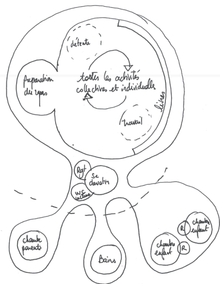
schéma de programmation élaboré au cours d'entretiens

Le travail collectif de conception du projet s'accompagne de celui portant sur les logements privés, en particulier par un repérage des « modes d'habiter » spécifiques à chaque foyer. Des entretiens favorisent la conception de logements adaptés d'une part et permet de concevoir des logements différenciés, chacun riche de qualités propres et appropriables.